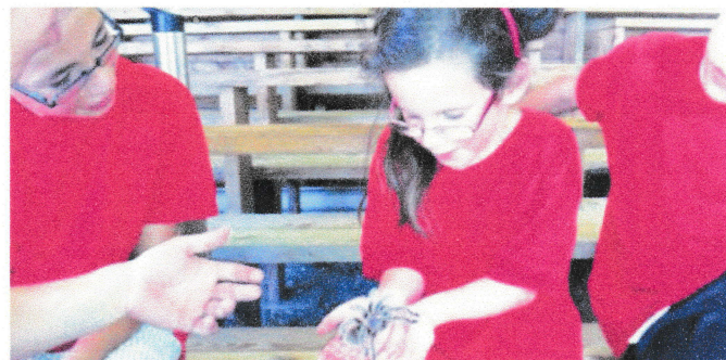
Visite de l'Exotarium de Saint-Eustache.

Pour s'inscrire : 450 667.5764 neurodeign.com